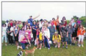
Aula Vivência Praia Naufragados