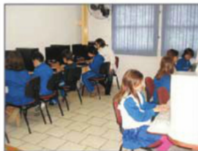
Laboratório de Informática