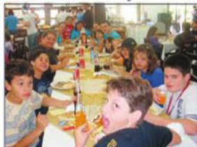
Festa da Família Parque da Malwee