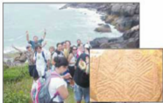
Aula Vivência Ilha do Campeche