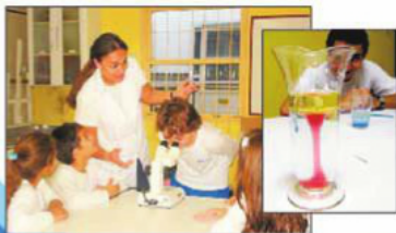
LABORATÓRIO DE CIÊNCIAS

"Lugar de experiências, de vivências, de apropriação do conhecimento!"