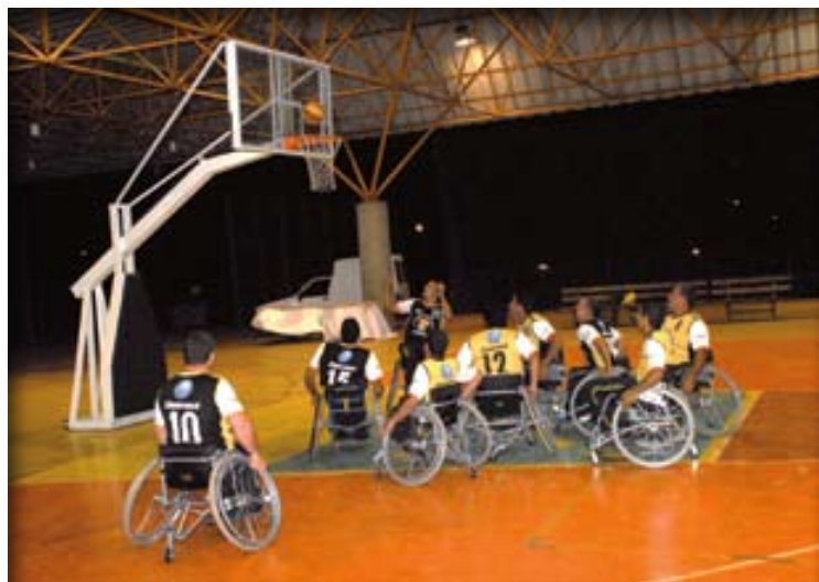
Esporte aumenta a autoestima e quebra barreiras