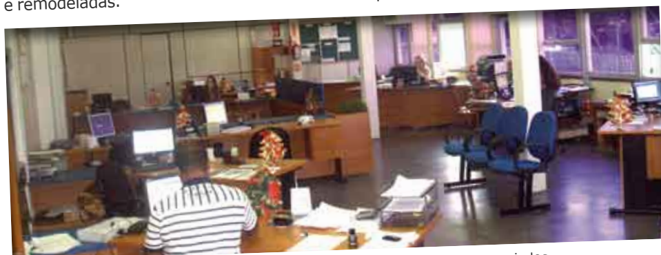
Nova configuração da secretaria trará mais conforto aos funcionários e associados

Nos próximos meses teremos a substituição do piso, a construção de um mosaico com o logotipo da empresa, colocação de ar condicionado Split, colocação de forro e uma nova iluminação. Também está prevista a substituição das cadeiras para uma padronização do ambiente e a troca das persianas para alumínio horizontal.