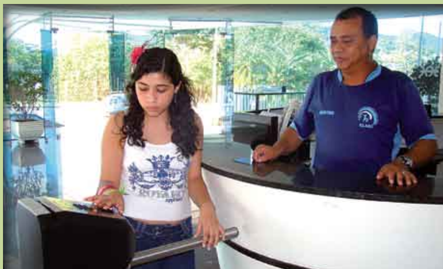
Catracas com leitura biométrica trarão mais segurança aos associados

Por isso, a diretoria da ELASE solicita aos associados, que ainda não coletaram suas digitais na secretaria do Clube, que o façam o mais breve possível.