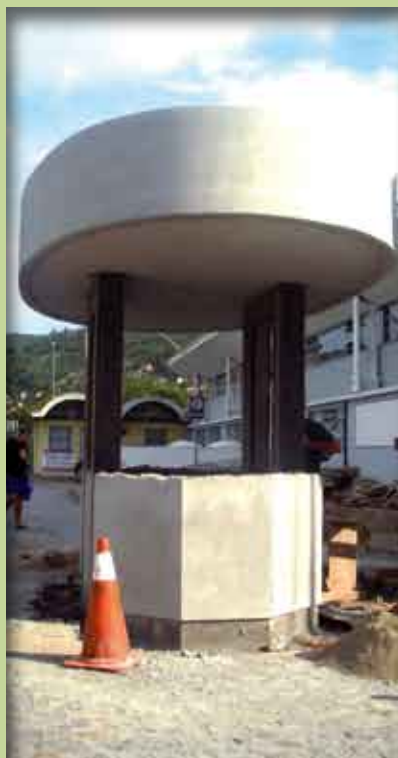
Nova guarita já está em fase de finalização

Pedimos a compreensão de todos os associados durante o período de obras.