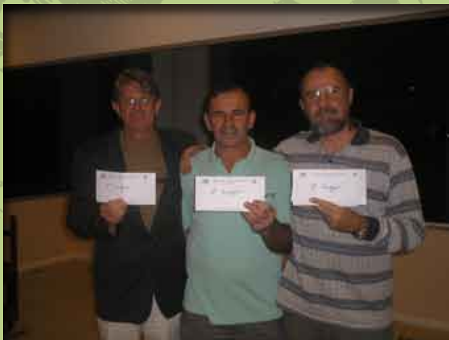
Integração entre associados é marca registrada nos torneios de Tranca e Canastra