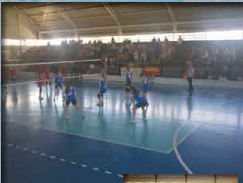
Acima, equipe de vôlei da ELASE em ação. Ao lado, time master em destaque

1º lugar | Clube Doze 2º lugar | ELASE 3º lugar | Colégio Catarinense 4º lugar | Osmar Cunha