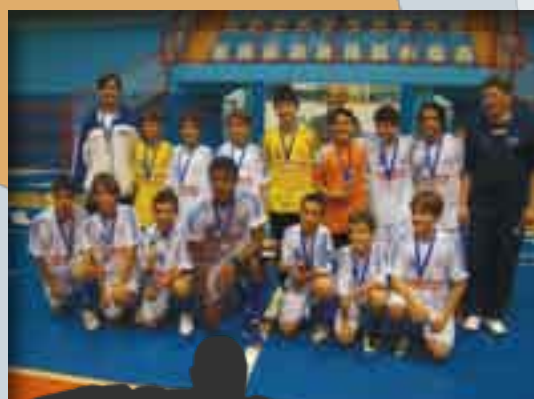
Atletas do Sub 9, Sub 11 e Sub 13 reunidos: excelentes resultados em 2008

No Campeonato Estadual, permanece a campanha vitoriosa. A Sub 13 venceu sete dos oito jogos realizados. A Sub 11 está invicta, com sete vitórias em sete jogos, e a Sub 9 conseguiu a classificação para a próxima fase.