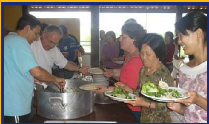
Participantes se deliciam com pratos feitos pelos chefes

A direção do GAS promete, para o segundo semestre, dar continuidade aos encontros que caíram no gosto dos associados.