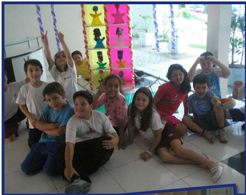
As crianças participaram de atividades lúdicas, recreativas, pré-desportivas, oficinas integradas e culturais

cos Lima, atendeu crianças de 3 a 12 anos, associados ou não do clube, no período vespertino, das 13 às 18h30, com duração de duas semanas.