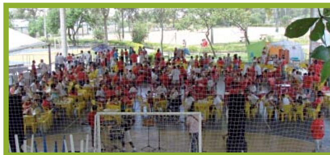
Cerca de 300 pessoas participaram da 3ª edição da Feijoada

Neste ano, o evento inovou com um espaço relax , oferecido pela clínica de fisioterapia localizada na ELASE. Massagens por apenas R$ 10,00 e produtos das linhas Racco, Antídoto e Mércur com mais de 50% de desconto também contribuíram para o projeto.